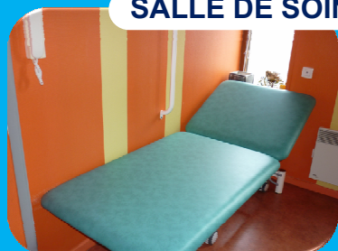
SALLE DE SOINS NURSING